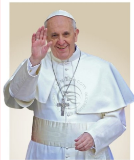
PAPIEŻ FRANCISZEK JORGE MARIO BERGOGLIO 13.III.2013

W najbliższy wtorek przypadają 88. urodziny papieża Franciszka – w osobistych modlitwach polecamy jego osobę i posługę Bożej Opatrzności, aby prowadził bezpiecznie Kościół przez niespokojne współczesne czasy.